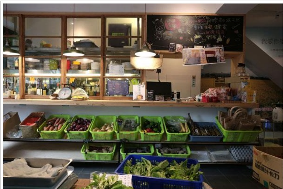
1樓蔬果區每日供應新鮮蔬果。