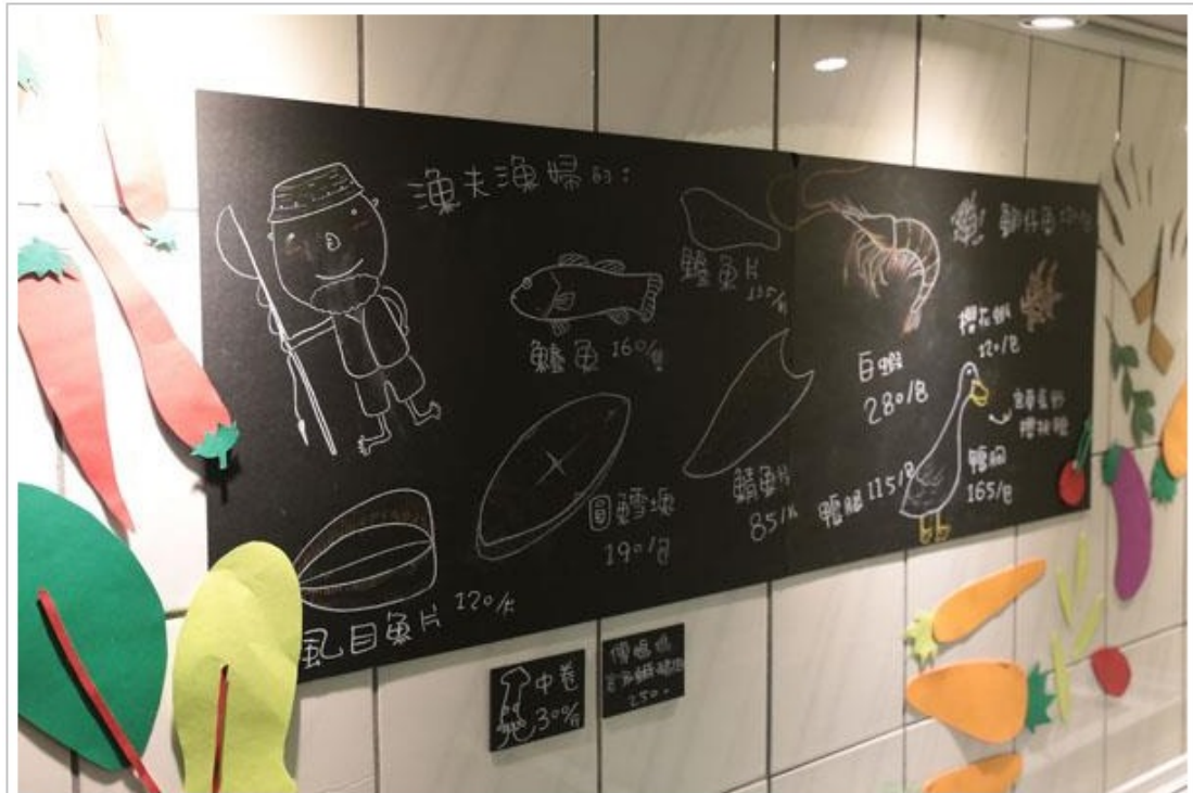
地下室生鮮區的黑板上，畫著許多模樣逗趣的食材。